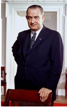
Президент США-.....1963-1969 гг.